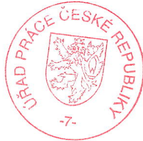
Mgr. et Mgr. Jacek Morávek zástupce vedoucí oddělení agentur práce

Podle ust. § 81 odst. 1 správního řádu, lze proti tomuto rozhodnutí podat odvolání k Ministerstvu práce a sociálních věcí, prostřednictvím Úřadu práce, u něhož se odvolání podává. Podle ust. § 83 odst. 1 správního řádu činí lhůta pro podání odvolání 15 dnů. Lhůta pro podání odvolání běží ode dne následujícího po doručení písemného vyhotovení rozhodnutí, nejpozději však po uplynutí desátého dne ode dne, kdy bylo nedoručené a uložené rozhodnutí připraveno k vyzvednutí.